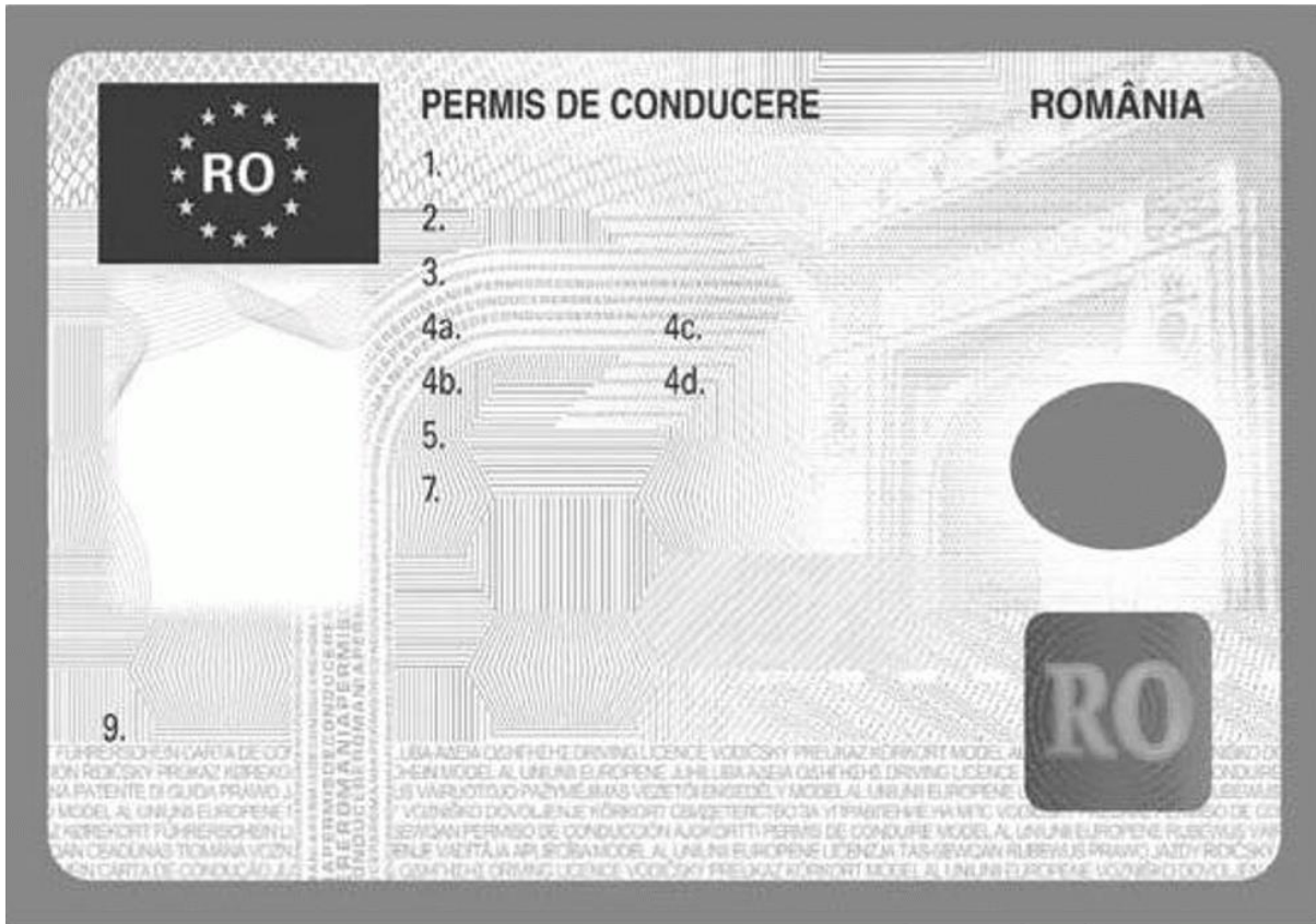
Figura nr. 2 – Fața II (verso) a permisului de conducere